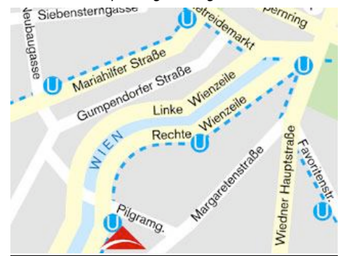
Lageplan Hotel Ananas kostenpflichtige Garage im Haus